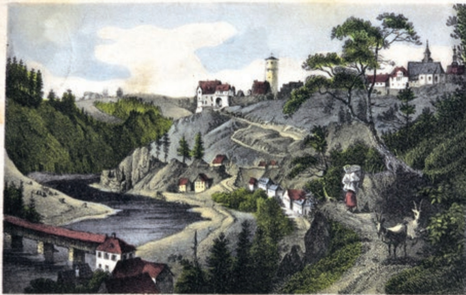
Saalburg a. d. Saale.